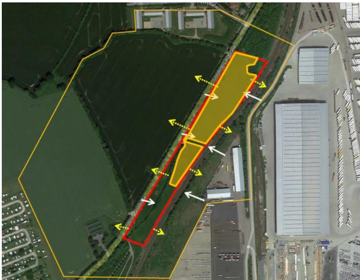
Abb. 1: Betrachtungsraum und Wirkräume der zu erwartenden Wirkfaktoren (Lärm und optische Einflüsse während der Bau- und Betriebsphase. Rote Umgrenzung = Direkter Wirkraum (Flächeninanspruchnahme); Orange Umgrenzung = Betrachtungsraum; Gelber Pfeil = Indirekte Wirkungen ausgehend von der Flächeninanspruchnahme; Weißer Pfeil = Indirekte Wirkungen ausgehend von bestehenden Straßen & Siedlungsstrukturen (Vorbelastung)