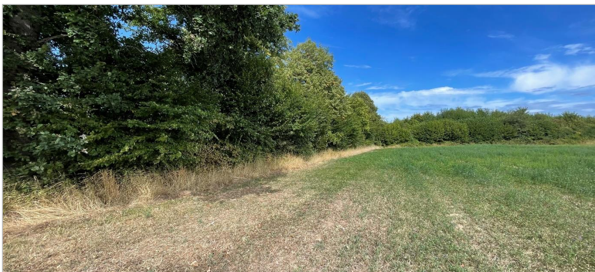
Abb. 2: Blick vom westlichen Rand des Plangebiets über die landwirtschaftlich genutzte Fläche in Richtung Norden; im Hintergrund ein Knick und ein Feldgehölz

Die Erlebbarkeit bzw. das Erholungspotenzial einer Landschaft ist abhängig von der Zugänglichkeit und der Einsehbarkeit, insbesondere durch Ausblicke von vorhandenen Wegen und Siedlungsbereichen.