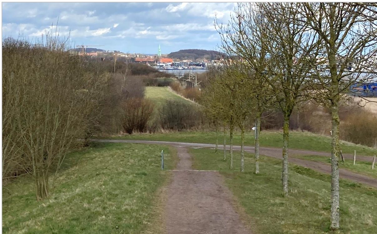
Abb. 3: Blick vom Hochpunkt der Geländeskulptur in Richtung Plangebiet

Westlich der Ivendorfer Landstraße verläuft ein Rad- und Fußweg von Ivendorf nach Travemünde. Ausgehend von diesem Weg bestehen keine Sichtbeziehungen zu den innerhalb des Plangebiets gelegenen Photovoltaikanlagen. Der südliche Teil des Plangebietes, der zwischen der Ivendorfer Landstraße und einem Knick verläuft, ist, ausgehend von dem benannten Rad- und Fußweg geringfügig sichtbar.